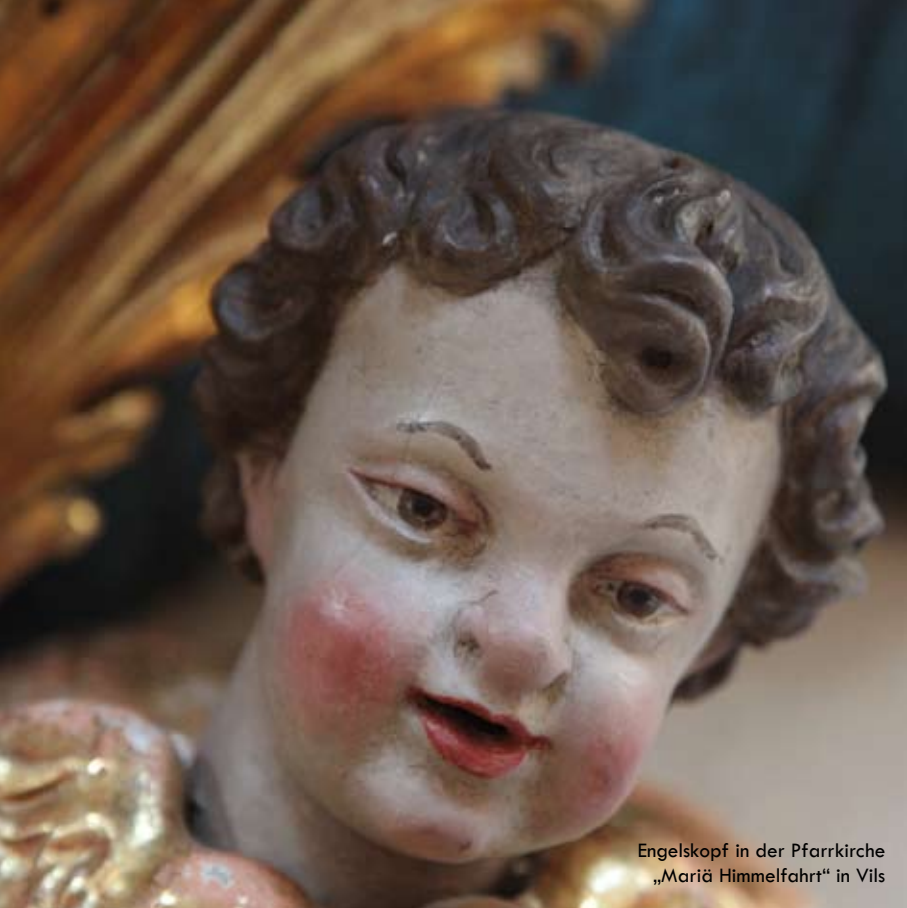
Engelskopf in der Pfarrkirche „Mariä Himmelfahrt“ in Vils