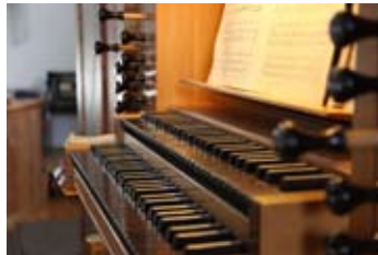
Spieltisch der Mayer-Orgel der Pfarrkirche „Mariä Himmelfahrt“ in Vils

Die Geige, die Sie auf dieser CD-Aufnahme hören, stammt nachweislich (durch den Einklebezettel) von Dominicus Rief. Sie stammt vermutlich aus dem Jahr 1796. Seit 1987 ist sie im Besitz von Gregor van den Boom und befindet sich bis auf ein erneuertes Griffbrett in einem nahezu originalen Zustand.