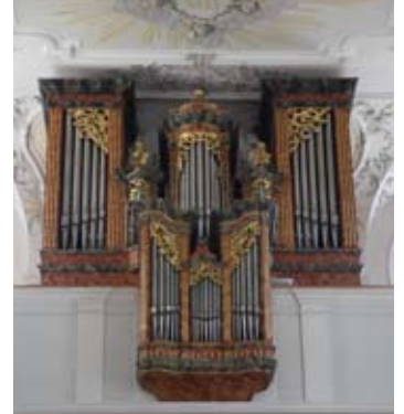
Prospekt der Mayer-Orgel der Pfarrkirche „Mariä Himmelfahrt“ in Vils

Die heutige Orgel der barocken Pfarrkirche „Mariä Himmelfahrt“ in Vils besitzt drei Vorgänger, während der Prospekt jeweils weitgehend beibehalten wurde. Die jetzige Orgel auf dem Obergeschoß der Westempore, ein von der Firma Gebrüder Mayer (Feldkirch, VlbG.) in das historische Gehäuse (Anwander 1790) eingebautes mechanisches Instrument mit Schleifladen, wurde 1995 eingeweiht. Die Disposition mit 18 klingenden Registern bietet auch in den leisen Stimmen soviel Farbenreichtum, um der Geige als gleichberechtigter Partner