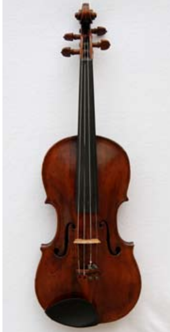
Rief-Geige dieser CD

Die Geige, die Sie auf dieser CD-Aufnahme hören, stammt nachweislich (durch den Einklebezettel) von Dominicus Rief. Sie stammt vermutlich aus dem Jahr 1796. Seit 1987 ist sie im Besitz von Gregor van den Boom und befindet sich bis auf ein erneuertes Griffbrett in einem nahezu originalen Zustand.